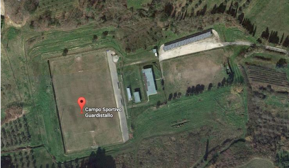
Fotografia Area di Ammassamento Soccorritori Stadio Comunale